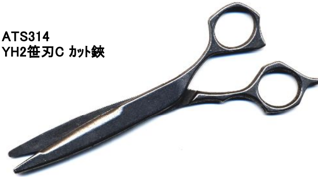
ATS314 YH2笹刃C カット鉗